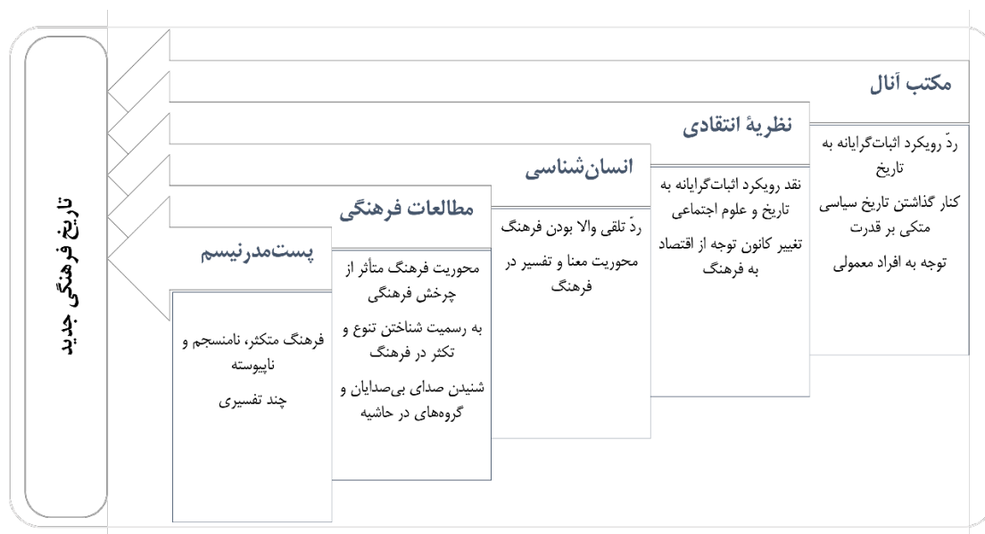
شکل ۲. زمینه‌های فکری شکل‌گیری تاریخ فرهنگی جدید

بخش‌هایی از مردم که مدت‌ها بود از تاریخ حذف شده بودند، موردتوجه قرار گرفتند. این چندتکه شدن تاریخ نه تنها به افول تاریخ‌نگاری نیانجامید که پژوهش متنوع و متکثری را به ارمغان آورد (ایگرس، ۱۳۹۸: ۸-۹). در سیر شکل‌گیری تاریخ فرهنگی جدید، زمینه‌های فکری و فلسفی بسیاری مؤثر بودند. از جمله این زمینه‌ها می‌توان به مکتب آنال اشاره کرد که از اولین مکاتب تاریخی بود که نگاه اثبات‌گرایانه به تاریخ و همچنین تاریخ فلسفی هگل را به چالش کشید. نظریه انتقادی نیز با تغییر کانون توجه از اقتصاد به فرهنگ از زمینه‌های فکری مهم شکل‌گیری تاریخ فرهنگی است. انسان‌شناسی با توجه به فرهنگ عامه به جای فرهنگ والا، زمینه را برای شکل‌گیری مطالعات فرهنگی آماده کرد. با ظهور مطالعات فرهنگی و چرخش فرهنگی، تنوع و تکثر در فرهنگ به رسمیت شناخته شد و تاریخ فرهنگی نیز به‌عنوان ثمره مطالعات فرهنگی، این تکثر را پذیرفت. محققان بسیاری به زمینه‌های فکری شکل‌گیری تاریخ فرهنگی جدید اشاره کرده‌اند. در شکل ۲ این زمینه‌ها جمع‌بندی شده‌اند.