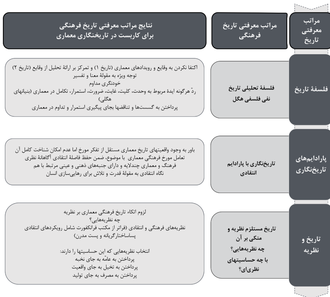
شکل ۳. نتایج مراتب مختلف تاریخ فرهنگی برای کاربری در تاریخ‌نگاری معماری

بی‌صدایان معماری ایران را نیز به گوش رساند. تاریخ فرهنگی معماری ایران، زنان ایرانی معمار یا محقق و مؤلف را نیز می‌شناساند و صدای آن‌ها را نیز به گوش می‌رساند. از نمونه‌های توجه مورخ فرهنگی معماری به مقوله بازنمایی می‌توان به بازنمایی معماری در متونی همچون تاریخ‌نامه و سفرنامه، شعر نقاشی، عکس و فرهنگ عامه؛ بعلاوه نشانه‌شناسی و بازنمایی معماری ایران در رسانه‌های جدید همچون مجلات معماری فیلم یا شبکه‌های اجتماعی اشاره کرد. همچنین در مقوله بر ساخت برای مثال مورخ فرهنگی می‌تواند به بر ساخت